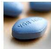
הוויאגרה עזרה להצמיח רקמת ריאה חדשה

בעולם היום נפתחים לשימושים נוספים לוויאגרה מלבד אין-אונות: בביה"ח בני ציון נתנו ויאגרה לפגה שסבלה ממחלת ריאות כרונית כתוצאה מלידתה המוקדמת. התרופה השפיעה לטובה על הריאות וסייעה בהתפתחות רקמת ריאה חדשה ובריאה