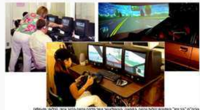
גפוליא"בני ציון" פועלים תחילת הדרך במסגרת ההסדרה של המרכז הרפואי בני ציון.

מחלקת השיקום של המרכז הרפואי "בני ציון" בשיתוף עם המכון לאבחון ושיקום כישורי נהיגה במרכז הרפואי היחיד מסוגו ממסולה ועד ת"א, מאבחנים ומשקמים נהגים פוסטנציאליים הסובלים ממוגבלויות על רקע התפתחותי ופגיעות נרכשות ובהן: אירוע מוחי, פגיעות ראש, מחלות נוירולוגיות שונות ודמנציה.