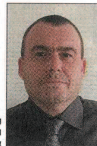
פרופ' שראל הלחמי

"שילוב הכוחות בין מחלקות בית החולים הביא לריפוי מלא ומוצלח של הנער", אמר השבוע סגן מנהל המחלקה האורולוגית במרכז בני ציון, פרופ' שראל הלחמי.